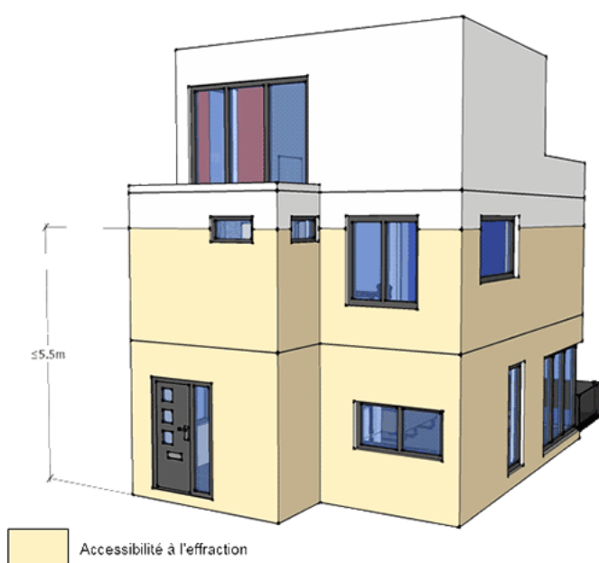
Figure 1 Accessibilité à l'effraction des parois extérieures conformément à la NEN 5087:2013.

* Étant donné que les effractions ont souvent lieu soit la nuit soit durant l'absence, longue ou non, des habitants, les volets roulants peuvent avoir un effet dissuasif ou, dans tous les cas, un effet retardateur. De plus, si les volets roulants sont également résistants à l'effraction, ils contribuent à la protection du bâtiment. Enfin, les volets roulants contribuent au confort thermique du bâtiment, ce qui reste un atout dans le cadre de la « Construction durable ».