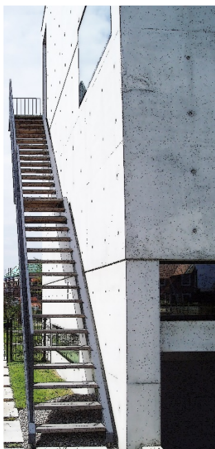
Figure 2 Exemple de zone d'accessibilité selon B

Une « surface d'effraction » est la partie de la surface de la toiture et de la façade accessible aux cambrioleurs depuis une zone d'accessibilité. Conformément à la NEN 5087:2013, une zone d'accessibilité est une surface présentant une pente maximale de 40 ° et capable de supporter un poids de 50 kg, cette surface pouvant être – Figures 3 et 4 :