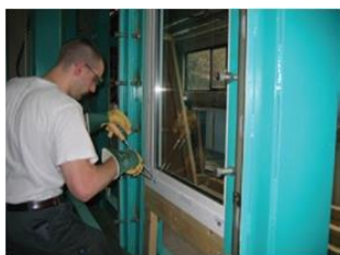
Figure 3 Essai manuel à l'effraction

L'essai manuel à l'effraction (voir Figure 3) est effectué en deux phases pour les classes de résistance 2 à 6 si l'élément a supporté les essais statique et dynamique. Lors de l'essai manuel préliminaire, l'objectif est de déterminer les points les plus faibles et les plus sensibles ainsi que le ou les outils les plus efficaces parmi l'ensemble des outils disponibles. Cet essai doit être effectué après que l'élément ait résisté aux essais statiques et dynamiques. Ensuite, sur la base des données recueillies lors du premier essai, l'essai manuel principal est effectué sur un nouvel élément de menuiserie. Au cours de cet essai, on tente de réaliser une ouverture dans le laps de temps imposé par la classe de résistance visée (voir Tableau 1).