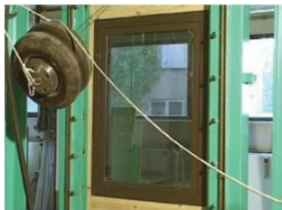
Figure 2 Essai dynamique

L'essai dynamique (voir Figure 2) est effectué pour les classes de résistance 1 à 3 si l'élément a résisté à l'essai statique. Pour cet essai, un double pneu d'une masse de 50 kg (décrit dans la norme NBN EN 12600) est lâché en plusieurs points prédéterminés de l'élément (centre et angles du panneau de remplissage, etc). La hauteur de chute dépend de la classe de résistance visée.