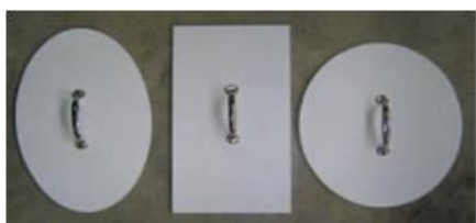
Figure 5 Calibres pour l'essai manuel.

L'élément testé respecte les exigences de la norme NBN EN 1627 pour une classe de résistance à l'effraction donnée si les déformations maximales autorisées ne sont dépassées à aucun moment. Les déformations maximales autorisées dépendent du type d'essai et/ou de charge et sont vérifiées à