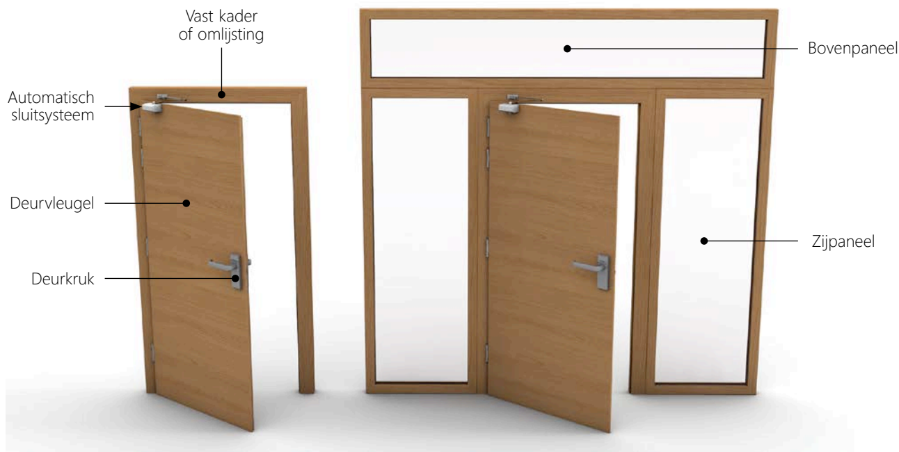
1 | Brandwerende deurgehelen (enkele vleugel).